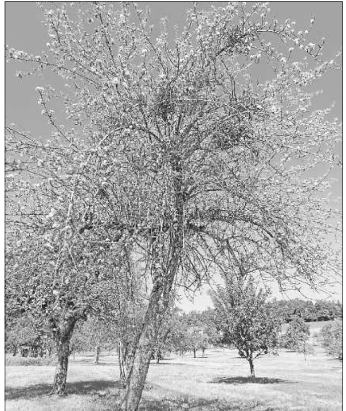
Massiver Mistelbefall

Die Mistelbekämpfung muss großflächig erfolgen, um einen raschen Wiederbefall der von Misteln befreiten Bestände zu verhindern. Nicht nur einzelne Streuobstwiesen, sondern auch umliegende Bereiche müssen also gepflegt werden.