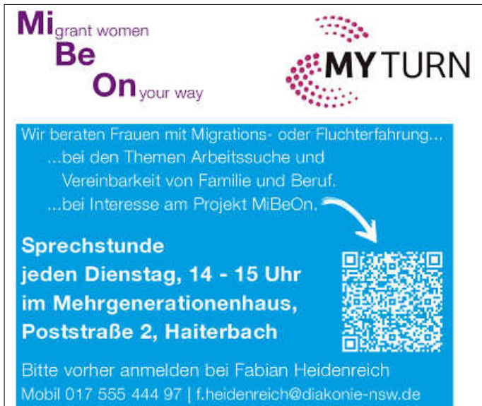
Bilder: Tabea Peters